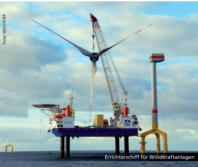
Errichterschiff für Windkraftanlagen