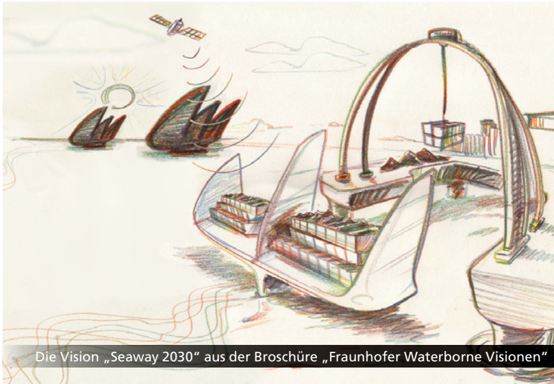
Die Vision „Seaway 2030“ aus der Broschüre „Fraunhofer Waterborne Visionen“

Gesamtkonzept wird aus verschiedenen verknüpften Systemen bestehen, wobei die Erweiterung und Verknüpfung von bestehender Technik im Vordergrund steht. Auf diese Weise können die Schiffe von heute zu autonomen Schiffen aufgerüstet werden. Neben der Entwicklung